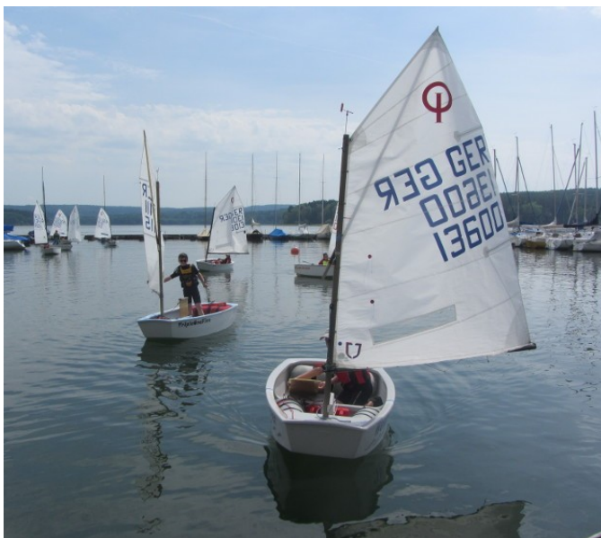
Ende mit Flaute

Der darauffolgende Sonntag wurde durch Gewitter geprägt. Da sich Blitze und Starkregen bekanntlich besser von Land aus beobachten lassen, verzögerte sich der Start mehrmals. Nachdem sich zum Nachmittag die Wogen sprichwörtlich geglättet haben und die Boote wieder leer geschöpft waren, ging es nochmals auf das Wasser, um eine vierte Wettfahrt zu bestreiten. Mit einer leichten Brise erreichten die Kinder die Startlinie, die sie aufgrund des dann gänzlich einschlafenden Windes leider nicht mehr verlassen konnten, was damit auch das Ende der Regatta bedeutete. Dem Spaß, den die Kinder auf dem Wasser hatten, tat dies keinen Abbruch. Mit vereinten Kräften wurde an Land gepaddelt, um dort nochmals in vollen Zügen zu planschen.